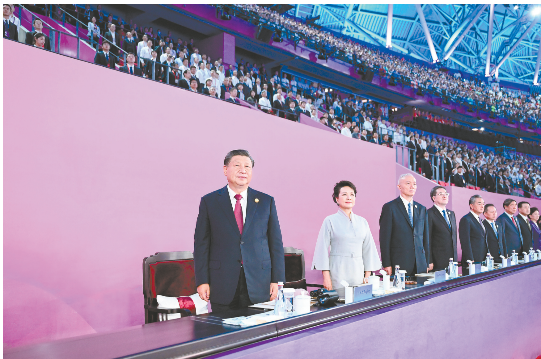
9月23日晚,第十九届亚洲运动会在浙江省杭州市隆重开幕。这是国家主席习近平在主席台上向大家挥手致意。