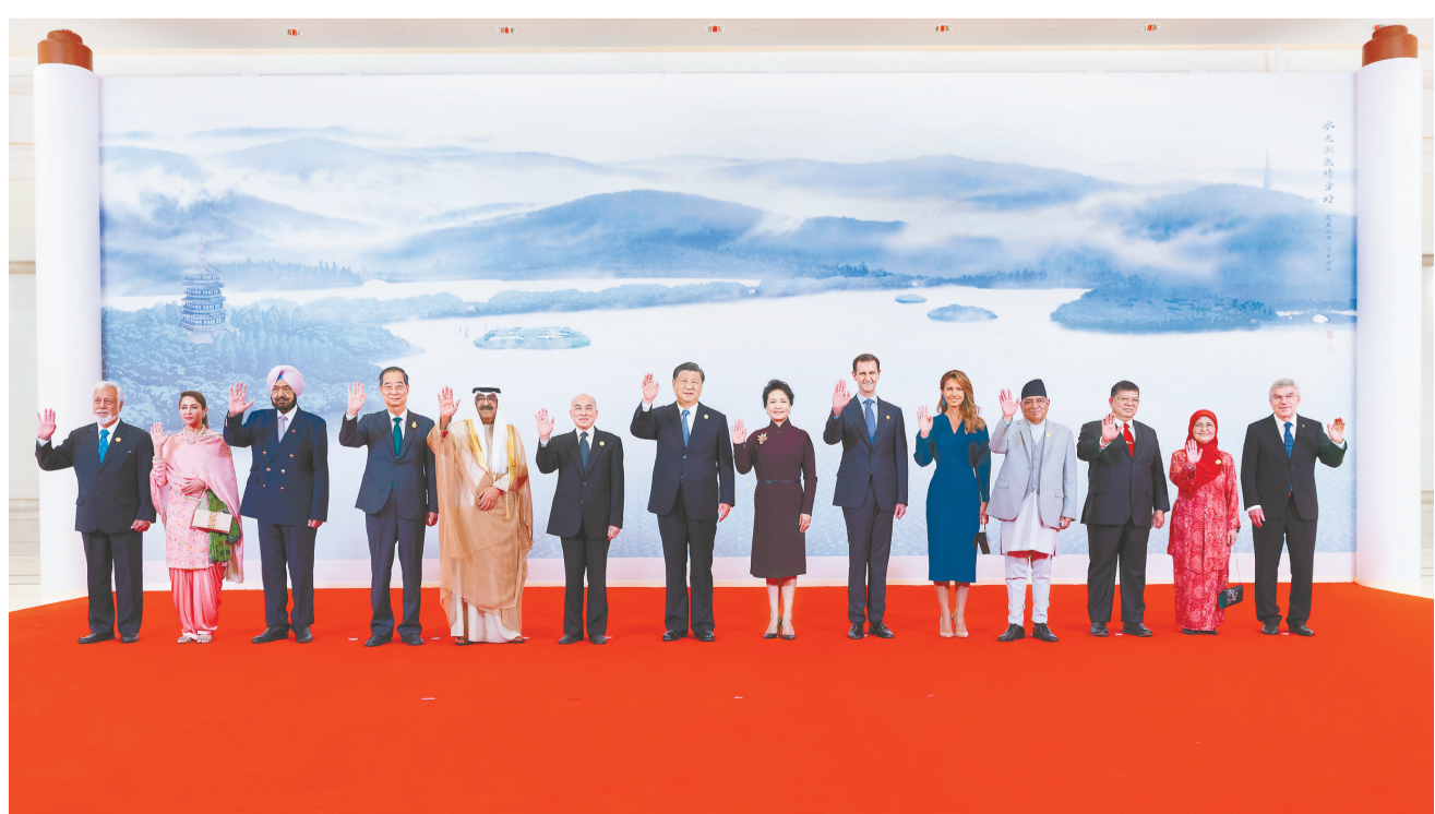
9月23日中午,国家主席习近平和夫人彭丽媛在浙江省杭州市西子宾馆举行宴会,欢迎来华出席杭州第19届亚洲运动会开幕式的国际贵宾。这是习近平和彭丽媛同贵宾们合影留念。