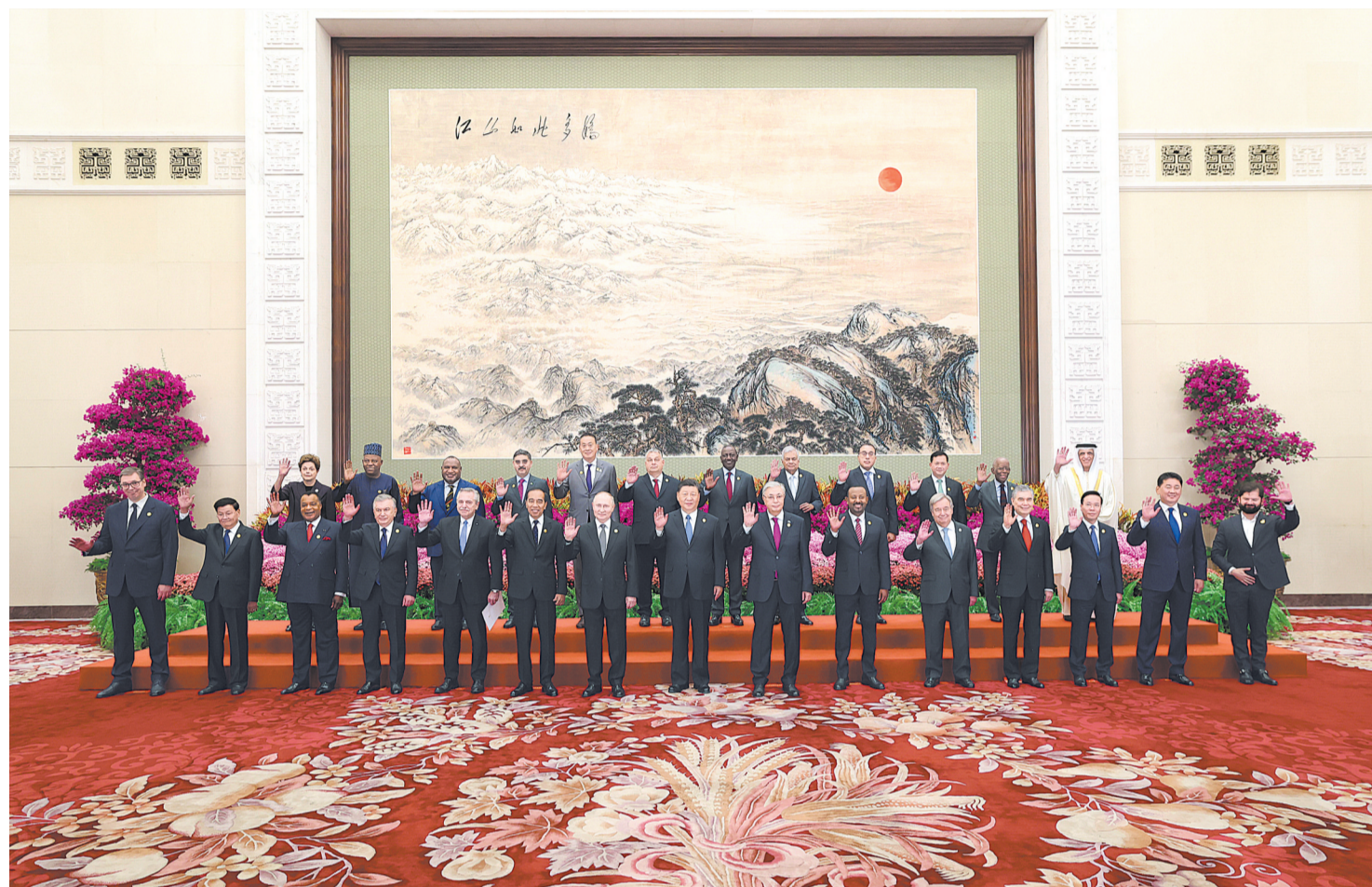
10月18日上午,国家主席习近平在北京人民大会堂出席第三届“一带一路”国际合作高峰论坛开幕式并发表题为《建设开放包容、互联互通、共同发展的世界》的主旨演讲。