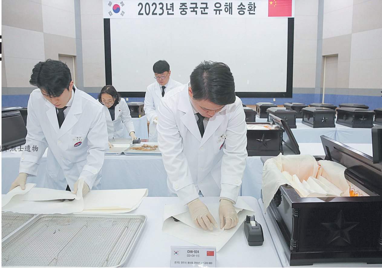
11月22日上午，第十批在韩中国人民志愿军烈士遗骸物装殮仪式在韩国仁川举行。23日，中韩双方将在韩国仁川国际机场举行烈士遗骸交接仪式。 此次韩方共向中方移交25名中国人民志愿军烈士遗骸及遗物。来自中韩两国政府以及军方的代表参加了仪式。 装殮仪式结束后，中韩双方将于23日在韩国仁川国际机场举行遗骸交接仪式，交接仪式后烈士遗骸将搭乘中国空军运-20专机返回祖国。