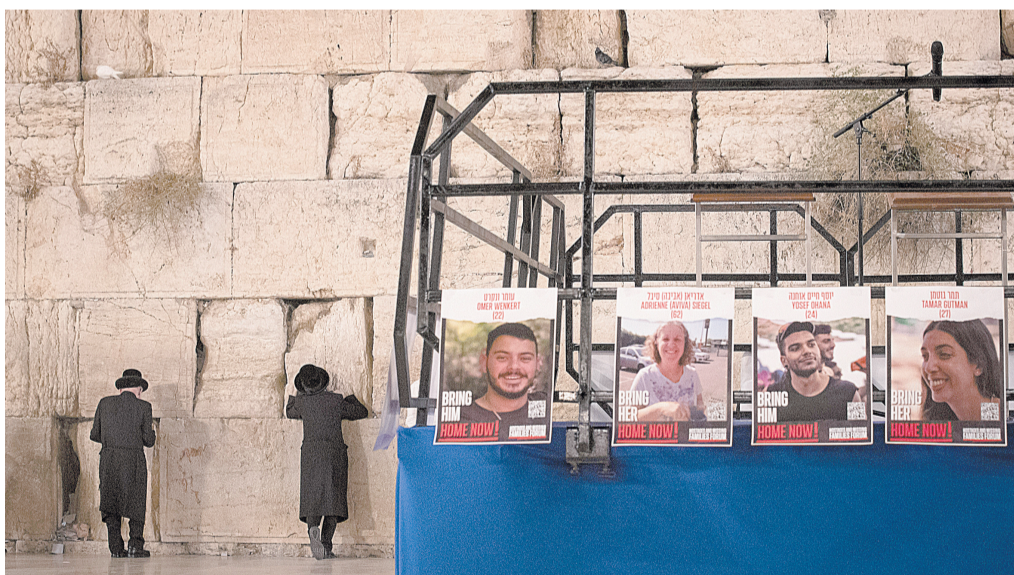
11月7日在耶路撒冷老城“哭墙”前拍摄的以色列被扣押人员海报

以色列政府22日凌晨宣布以军将在加沙地带短时间停火，换取巴勒斯坦伊斯兰抵抗运动(哈马斯)释放部分被其扣押人员。 以色列总理本雅明·内塔尼亚胡21日先后召集战时内阁、安全内阁和全体内阁会议，讨论这份临时停火协议直至22日凌晨。以色列政府在一份声明中说，根据协议，以军将停火4天，哈马斯在这一期间释放50名妇女儿童。今后，哈马斯每释放10名被扣押人员，以军停火一天。 以方称，哈马斯在10月7日针对以色列境内军民目标的突袭中掳走大约240人。 哈马斯迄今释放4人，并称一些在押人员已死于以军对加沙地带的持续空袭。 以色列政府声明并未提及以方将释放部分巴方人员。《耶路撒冷邮报》报道，根据协议，哈马斯将分批释放50名妇女儿童。作为交换，以方将释放大约150名关押在以色列监狱中的巴勒斯坦妇女儿童。另外，临时停火期间，包括燃料在内的人道主义援助物资可进入加沙地带。 哈马斯10月7日自加沙地带突袭以色列境内军民目标，以方称造成大约1200人死亡。以色列随后进入战争状态，对加沙地带发起军事行动。哈马斯21日发表声明说，以军行动已造成加沙地带超过1.4万人死亡，其中将近1万人是妇女儿童，另有3.3万余人受伤，超过6800人失踪。 内塔尼亚胡在以方同意临时停火前说，“我们将要作出一个艰难决定，但这是正确的决定。”他同时警告，这份协议并不意味着以军将终止在加沙地带的军事行动。“我们在进行一场战争，并将继续下去，直至达成全部目标，即消灭哈马斯、解救所有人质，确保加沙地带没有实体能威胁以色列。”