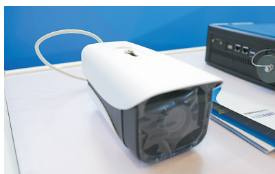
量子赋能智能监控系统