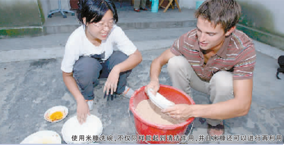
使用米糠洗碗，不仅同样能起到清洁作用，并且米糠还可以进行再利用。

3 个法国的年轻人今年 4 月从奥马尔市出发，经德国、俄罗斯、蒙古，然后进入中国，然后经北京、西安等城市，于昨天上午抵达成都，几个月的行程伴随他们的是一辆自行车，他们的目的地是南印度。他们这种苦行僧式的跋涉并非仅仅为了获得个人的旅行体验，而是为了收集“可持续发展”经验。成都之所以吸引他们，是因为从中文网页上看到在郫县安龙村实施的“农业可持续发展项目”。生态环境保护是全球关注的主题，“但在整个欧洲，几乎没有人知道，属于发展中国家的中国在环境保护方面做了如此多的努力，我希望把我们看到的传递给欧洲的人们。”在他们看来，成都在安龙村实施的生态项目是先进的，这点令他们感到惊奇。