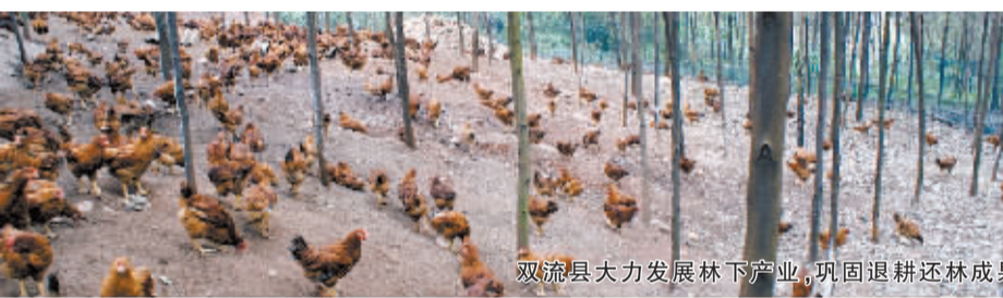
双流县大力发展林下产业,巩固退耕还林成果

郁郁葱葱的森林随风飘逸,随着2002年实施退耕还林工程以来,双流县共实施退耕还林3.2万亩,而如何依托这样的“绿色”发展后续产业,见到“绿色生金”的效益?近年来,林下养殖成为了双流县退耕还林后续产业发展的一剂“强心针”。通过林下发展鸡、兔等生态养殖业,让林农在短期内实现增收,向退耕林地要效益,巩固了退耕还林成果,双流县的林下养殖成为了全市推广的“样本经”。