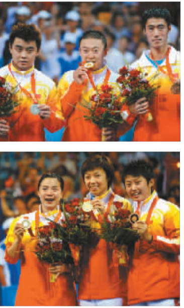
中国选手包揽北京奥运会男单、女单奖牌

国际乒联为了解决中国队,想出的办法也可谓是最后的招数了,毕竟从比赛规则上改革,中国选手都能很好地适应。此前不管是改大球还是限制球拍,中国选手都是最先适应,欧洲选手反而适应得比较慢,所以从某种程度上说让中国队拥有了更大的优势。这次从参赛名额上进行限制,对于很难有选手通过预选赛打入奥运会的乒乓球球队来说是一大福音,强队的参赛名额遭到削减将会使这些协会参加奥运会单打比赛的机会大增。但这也削弱了乒乓球比赛的观赏性,最终的受害者是广大球迷。