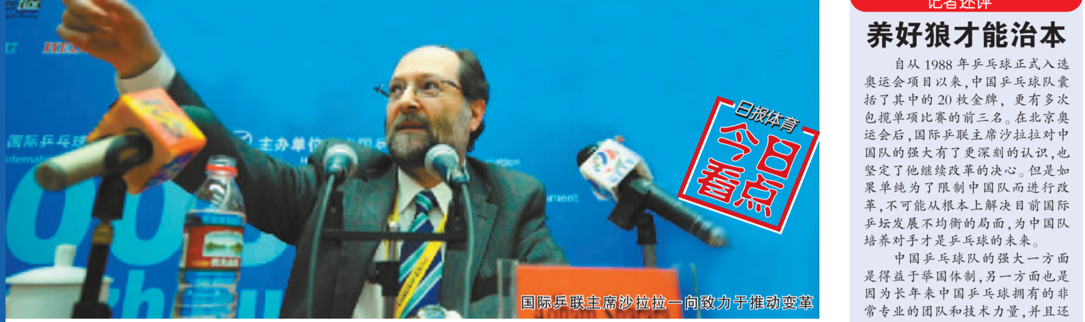
国际乒联主席萨拉拉一向致力于推动变革