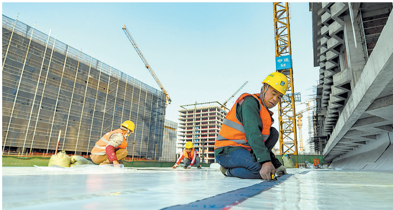
2月2日,在成都芯谷产业功能区配套设施建设工程工地上,工人正加紧施工,全力推进项目建设进度。