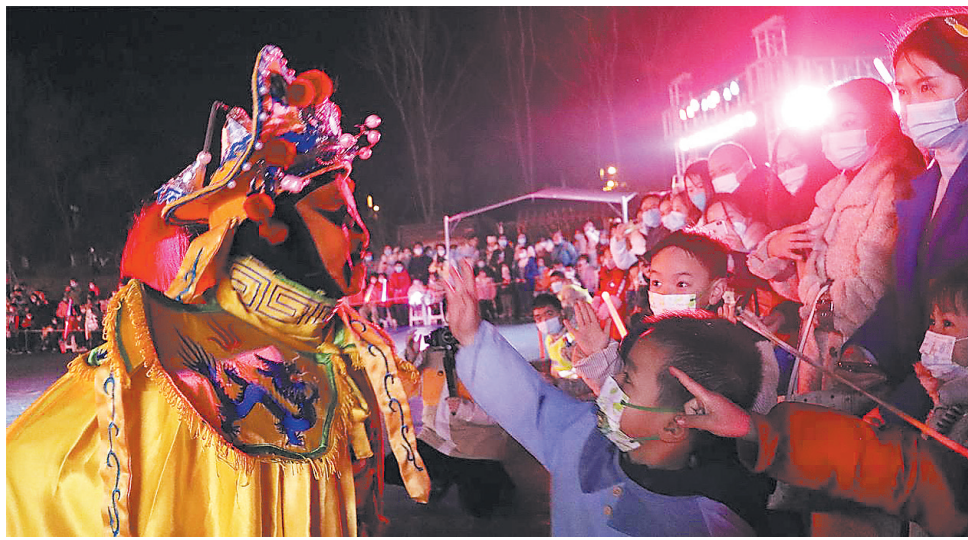
观众欣赏四川特色民俗表演——变脸

除了汉服盛装巡游、板凳舞狮踩青撒福、元宵花灯、武庙元宵祈福、包元宵吃元宵等传统活动外,还将举行快闪、新春国风趣味运动会等年轻群体青睐的时尚活动,让市民感受魅力