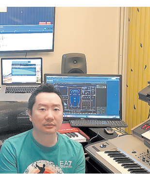
著名音乐人胡小鹏

在春节期间,夜游锦江也将再次推出元宵特别活动。“元宵节当天,游客可以与npc(非玩家角色)精彩互动,身临其境,感受千年前盛唐时期锦江春日不夜城的盛景。”据夜游锦江的相关负责人透露,在正月十五