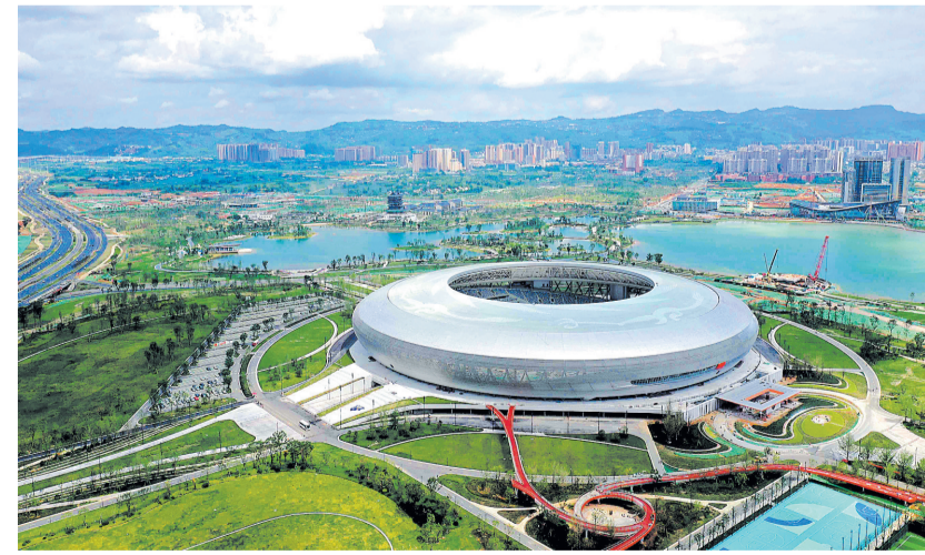
成都大运会博物馆位于东安湖体育公园主体育场。

据悉,有关部门正抓紧吸收落实专家和市民意见,进一步完善展陈内容,丰富展陈藏品,优化展陈环境,并按有关程序进行评估和审定。