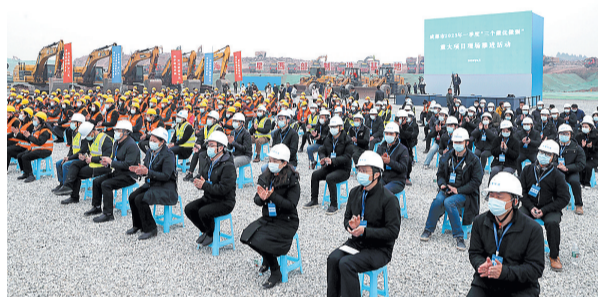
成都东部新区临空制造工业总部基地项目现场

某种程度上说,临空经济是经济高质量发展的主要参照。此次成都东部新区(临空经济区)、成都天府国际机场。东部新区相关负责人介绍,该项目围绕培育“六上”企业实际要求,着力建设国际空港经济区首个覆盖研发制造、人才居住、生活配套等功能的综合体,总投资16亿元。目前已确定入驻派铂宇航航空管路等3个制造基地项目,总投资13.3亿元。储备了成航航材基地等8个高能级产业化项目。