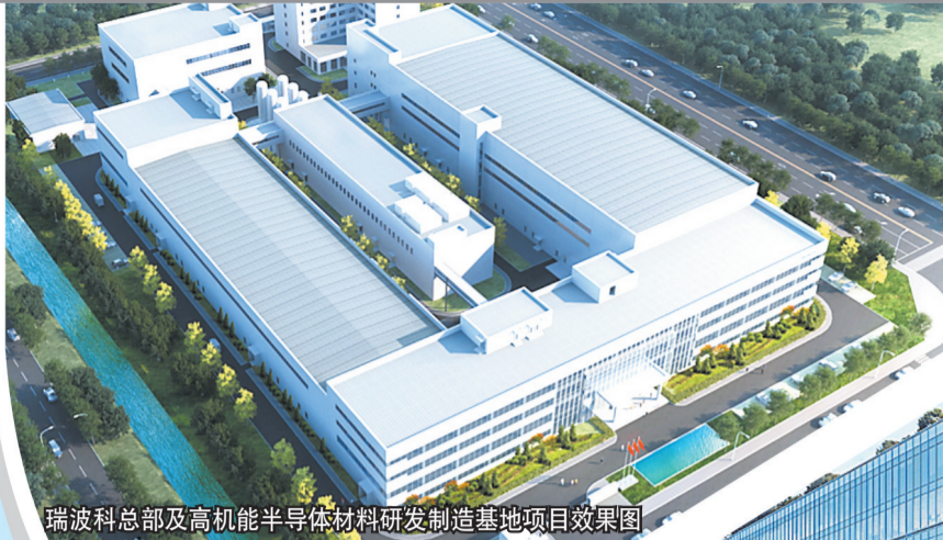
瑞波科总部及高机半导体材料研发制造基地项目效果图

记者注意到,此次活动主会场设在成都东部新区临空制造工业总部基地项目现场。《成都天府临空经济区建设方案》近日发布后,临空经济区再次成为焦点。频频登上“热搜”的背后,透露出怎样的信号?