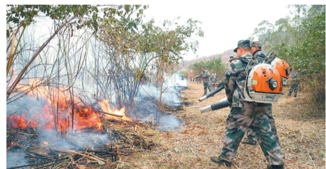
成都市2023年森林草原火灾应急演练