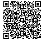
《意见》全文 见锦观新闻

监督贯通协调的工作机制;财会监督法律制度更加健全,信息化水平明显提高,监督队伍素质不断提升,在规范财政财务管理、提高会计信息质量、维护财经纪律和市场经济秩序等方面发挥重要作用。