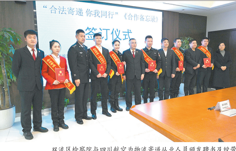
双流区检察院与四川航空为物流寄递从业人员颁发聘书及绶带