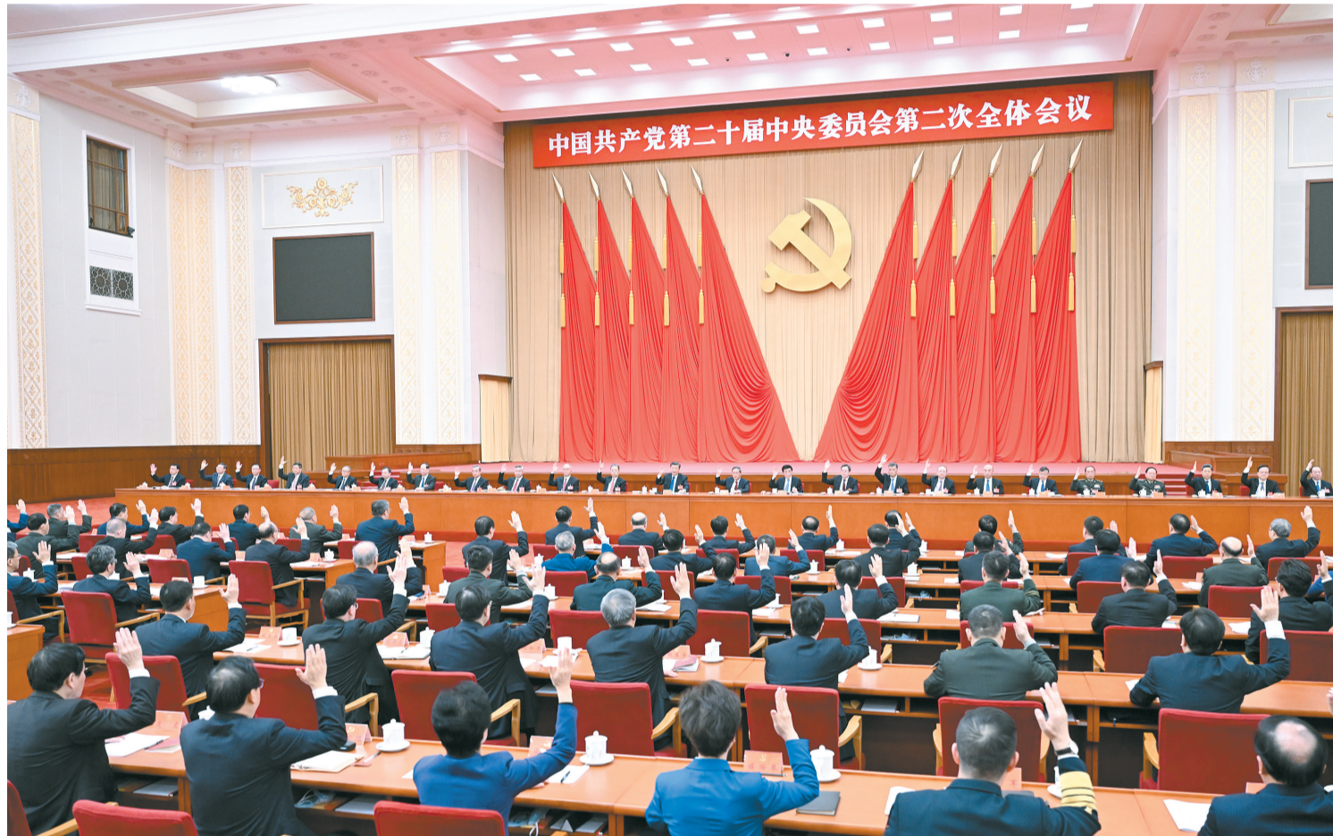
中国共产党第二十届中央委员会第二次全体会议,于2023年2月26日至28日在北京举行。中央政治局主持会议。新华社记者 燕雁 摄

新华社北京2月28日电 中国共产党第二十届中央委员会第二次全体会议公报 (2023年2月28日中国共产党第二十届中央委员会第二次全体会议通过) 中国共产党第二十届中央委员会第二次全体会议,于2023年2月26日至28日在北京举行。 出席这次全会的有中央委员203人,候补中央委员170人。中央纪律检查委员会书记和有关部门负责同志列席会议。 全会由中央政治局主持。中央委员会总书记习近平作了重要讲话。 全会听取和讨论了习近平受中央政治局委托作的工作报告,审议通过了中央政治局在广泛征求党内外意见、反复酝酿协商的基础上提出的拟向十四届全国人大一次会议推荐的国家机构领导人员人选建议名单和拟向全国政协十四届一次会议推荐的全国政协领导人员人选建议名单,决定将这两个建议名单分别向十四届全国人大一次会议主席团和全国政协十