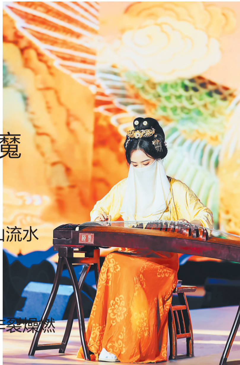
2021年常州·抖音国风大典