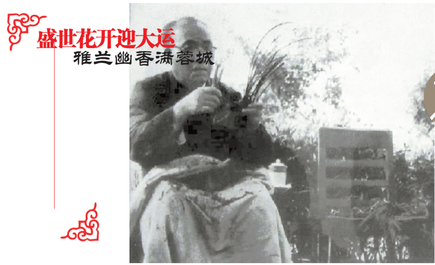
盛世花开迎大运 雅兰幽香满蓉城