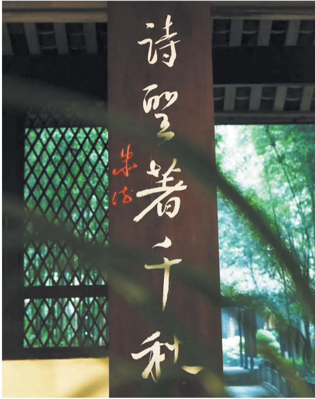
1957年朱德第一次到草堂时写下的对联（下联）

伍若兰去世后，朱德深感悲痛，并把对她的怀念，化作了高品质高洁的兰花的热爱。在朱德元帅一生所做的40余首与兰花相关的诗词中，我们能够感受到这位共产党人内心深处那一抹最柔软的情思。