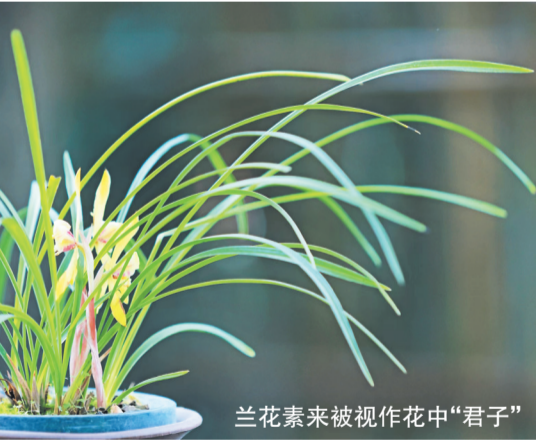
兰花素来被视为花中“君子”

新中国成立后，朱德更是将培植兰花当成了生活中必不可少的雅趣。在朱德住处的阳台和花架上，随处可见兰花花影。在这方小天地中，朱德共培植了几千盆品种不同的兰花，而且在闲暇之余，朱德还会亲自照顾兰花，为它们除草、培土、浇水、施肥，有时还会面对兰花，或静坐、或凝视、或沉思。