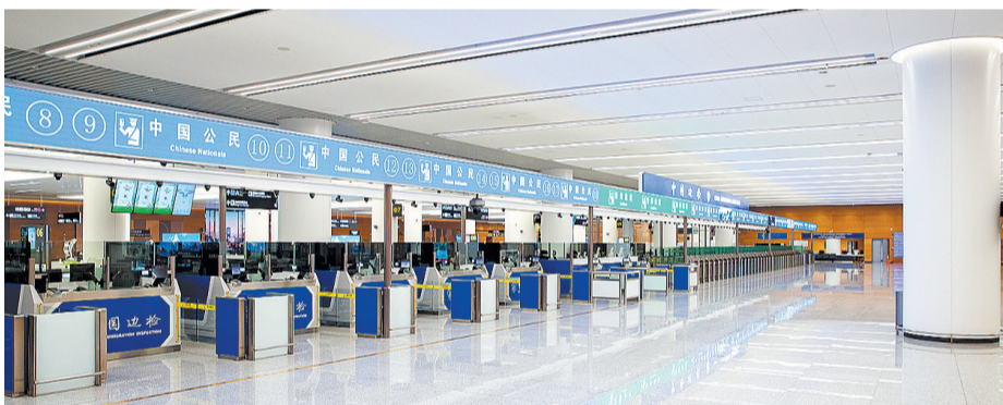
天府国际机场入境边防检查查验区