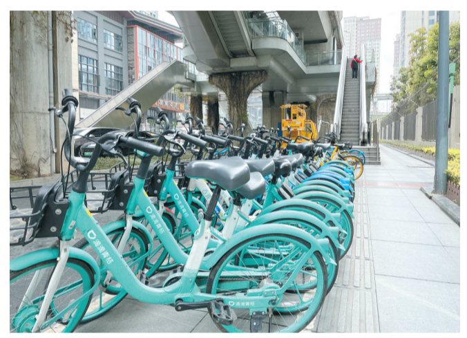
共享单车整齐停放在人行道一旁

交通场站既是市民日常生活中最常往来的场所,也是城市形象对外展示的一扇窗口。3月28日,记者走访了位于成华区双福一路上的快速公交双桥子北站和位于锦江区的地铁市二医院站。在这里,曾经存在的不文明问题得到了一定的改善,人来人往的交通场站附近,市民的出行变得更为便捷高效。