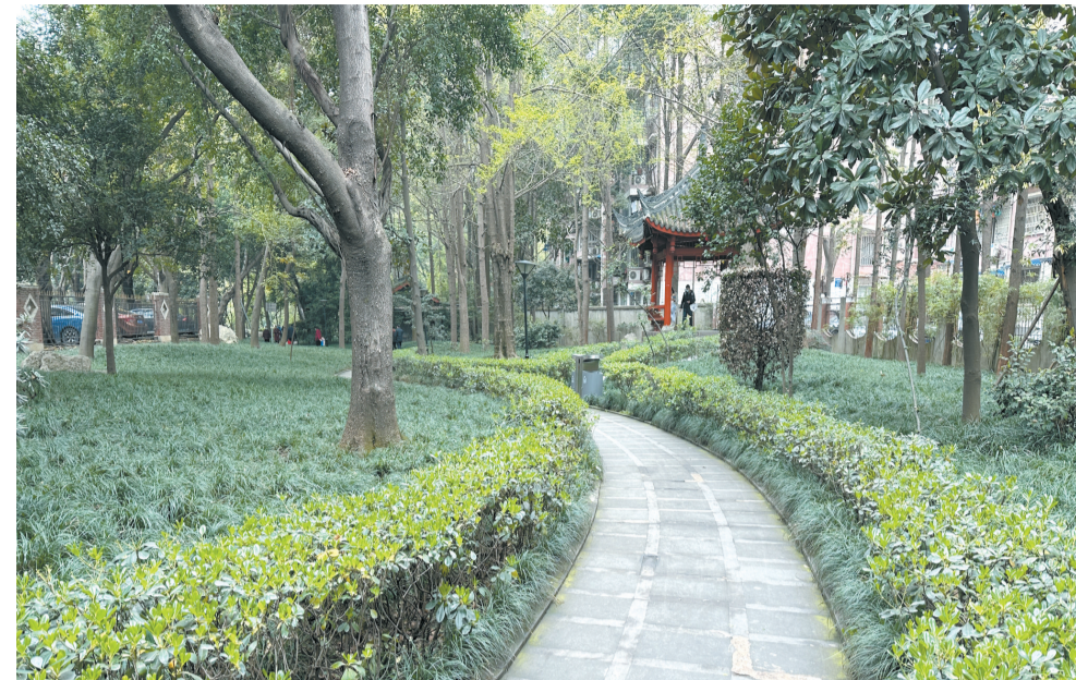
九里堤公园通道干净整洁