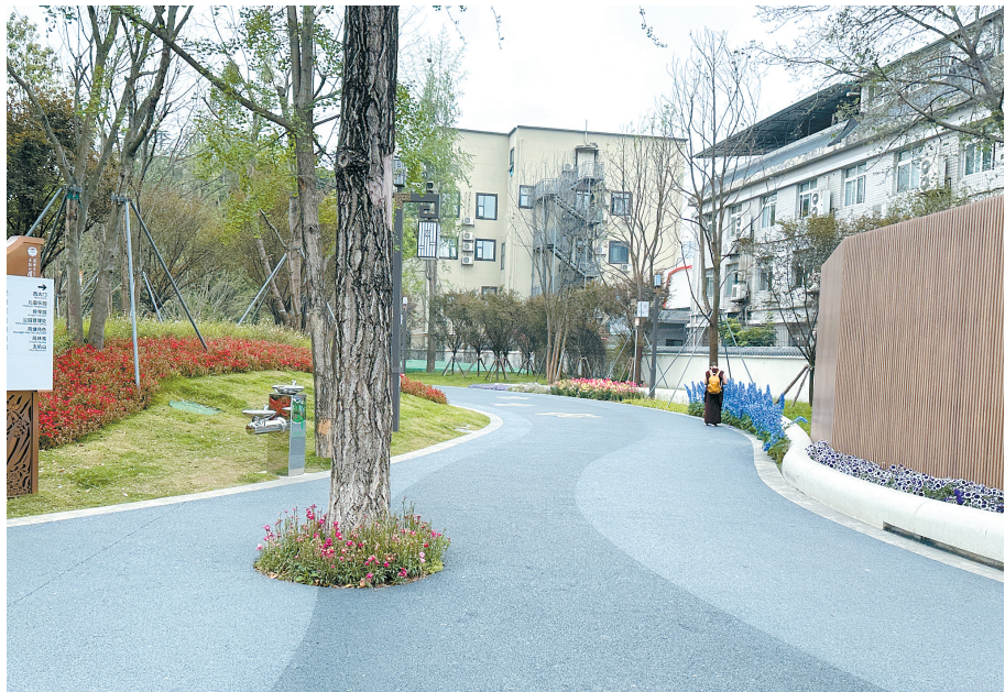
文化公园内,花丛修剪整齐、绿道干净整洁

不到300米的小街古韵犹存。在繁忙的工作日上午,来往市民文明出行,呈现一派和谐之景。