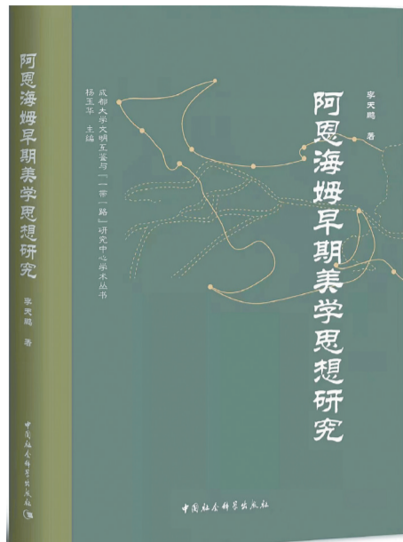
《阿恩海姆早期美学思想研究》

母亲会越来越老,以她的智慧勇敢、变通乐观,也势必会越来越越好。母亲节了,遥祝母亲健康快乐。