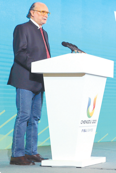
中国·成都 CHENGDU CHINA