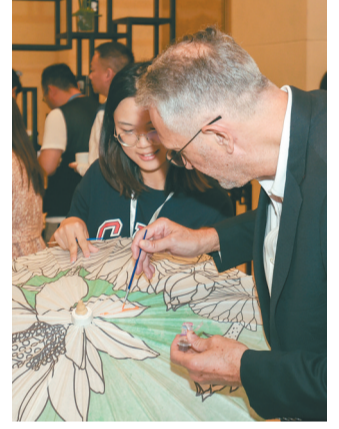
5月15日,在第31届世界大学生夏季运动会世界媒体大会现场,古香古色的油纸伞受