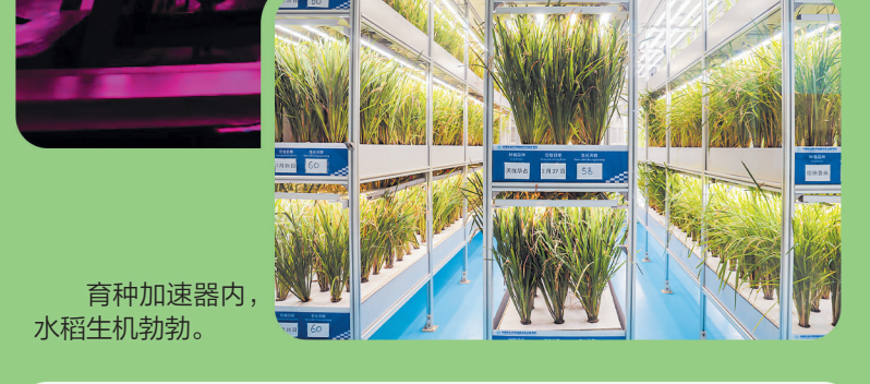
育种加速器内，水稻生机勃勃。