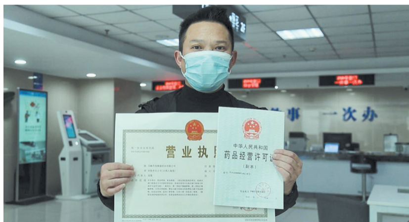
药店“个转企”为有限责任公司

即日起,本报推出系列报道,聚焦市场监管部门是如何带着“清单”沉到一线,主动服务个体工商户,精准助力转型升级推动高质量发展的。