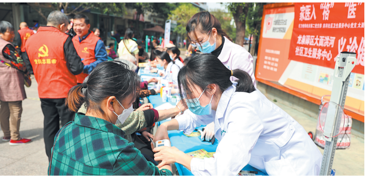
微网格家庭医生团队在服务点开展健康服务

居民突感身体不适,微网格员巡查发现后立即报告家庭医生团队,居民的健康问题在最短时间里就能解决;家庭医生团队对微网格员进行医疗技能培训,提升微网格员健康服务能力。