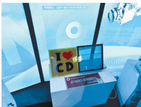
发电玻璃 有光就有电

生产的碲化镉发电玻璃,是一种新型绿色能源建筑材料,产品发电效率高、损失小,颜色、透光度、尺寸形状可定制,适用于多种复杂环境且低碳、安全、环保、可回收。