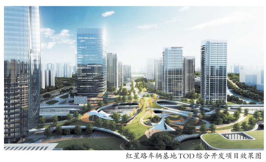
红星路车辆基地TOD综合开发项目效果图

“红星路车辆基地实施TOD综合开发,不仅能让车辆基地继续发挥原有保障交通运输的重要功能,还能通过上盖物业开发,实现土地高效集约利用和功能融合,进一步增强区域人口承载能力,助力城市发展更新,提升城市空间品质。”轨道集团相关负责人表示,成都轨道集团将学习贯彻习近平新时代中国特色社会主义思想主题教育与推动中心工作落实同谋划、同部署,主动服务城市高效能治理、市民高品质生活。据介绍,该项目聚焦“成都未来公园社区新范本 轨道TOD综合开发新时代”的总体定位,构建“一心两轴五区”总体布局,即以地铁五根松站为核心,打造慢行与商业结合的生态休闲轴以及连接车辆东西两侧的城市生活轴,形成两个商业片区和三个居住