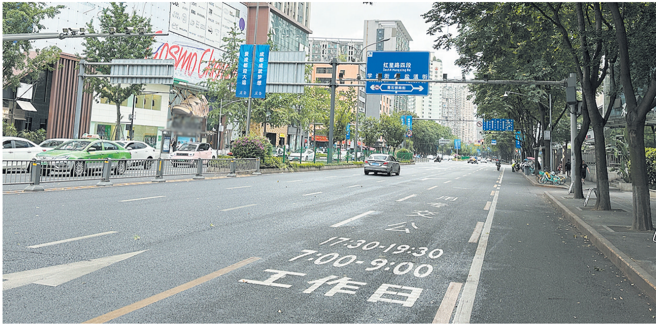
锦兴路的公交专用车道新增了醒目的标识、标线

6月1日起,成都市中心城区公交专用车道实施优化调整措施。该措施实施后,驾驶员的感受如何?道路交通状况是否得到改善?昨日,记者进行了走访调查。 上午10点,记者首先来到东城根上街,该条道路实行公交车道取消措施。在现场,记者观察到地面的“公交专用”标识已被清除,地面上只留下了些许的印迹。“我在这附近上班,每天一到上下班高峰期,路就会变得特别堵,但是旁边的公交车道又没什么车,现在取消公交专用道后,相比以往确实感觉堵车的状况有所缓解。”市民陈