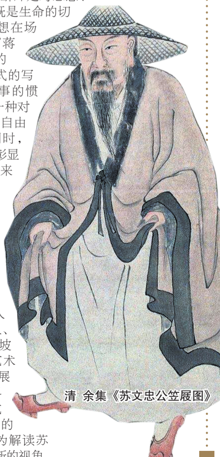
清 余集《苏文忠公笠展图》

表述其思想。“断片是对思想、事件的深型,既是生命的切片,又是对思想在场的无限贴近。”蒋蓝说,“这样的辞典式、断片式的写作,逾越了叙事的惯常,恰恰也是一种对于苏东坡思想自由性的体现。同时,也开门见山地彰显了东坡人生的来路与去向。”