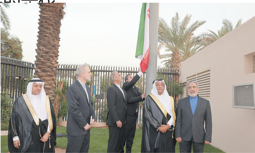
伊朗副外长比格德利(右二)等在沙特阿拉伯利雅得重新开馆

沙特与伊朗2016年断交。在中国斡旋下,沙特和伊朗两国代表今年3月6日至10日在北京举行对话,中沙伊三方签署并发表联合声明,宣布沙伊双方同意恢复外交关系。4月6日,沙伊双方签署联合声明,两国宣布即日起恢复外交关系。