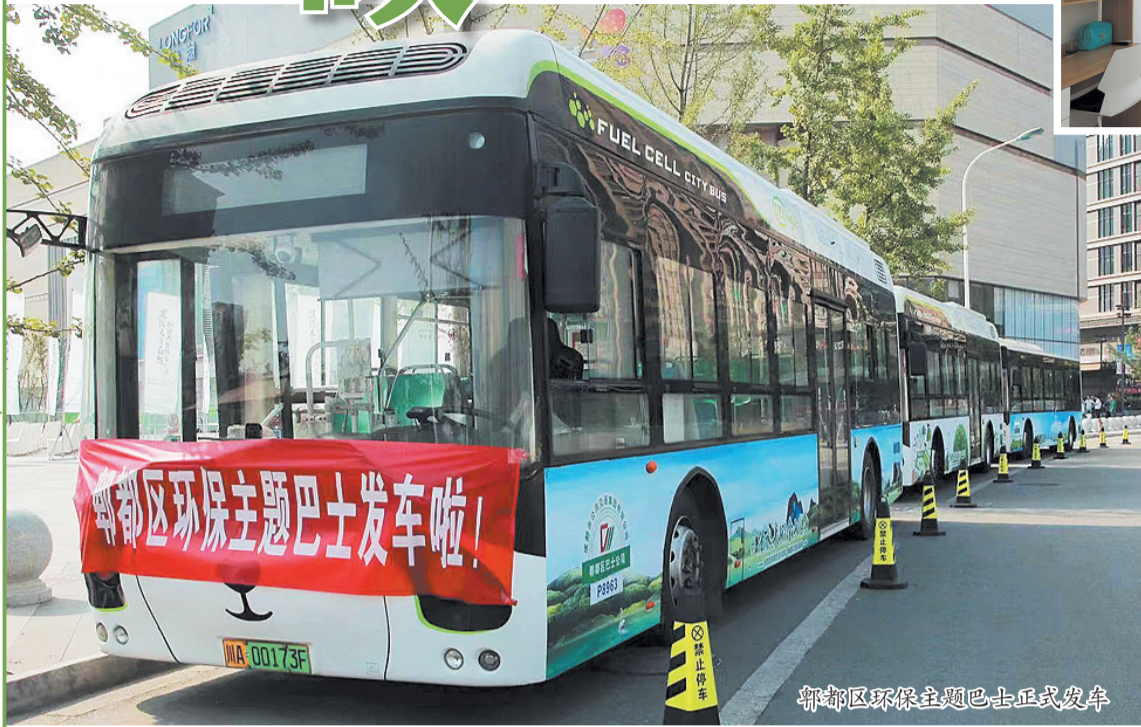
郫都区环保主题巴士正式发车