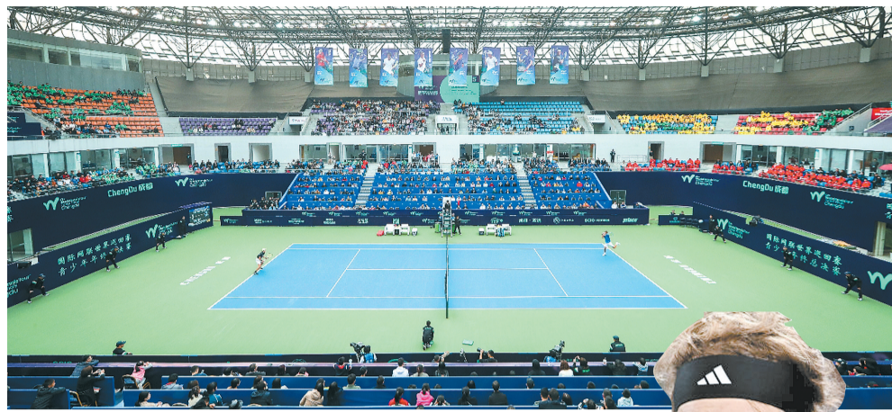
四川国际网球中心

作为最丰厚的大运遗产,大运场馆的活化利用多元且丰富,持续举办的体育赛事也让成都依然活力满满。“成都网球季”作为世界赛事名城的一块响亮招牌,在9月和10月间将连续带来三场国际网球盛宴,ATP250成都公开赛、国际网联世界青少年巡回赛(J60)和国际网联世界巡回赛青少年年终总决赛接续大运精彩,将掀起一场世界网坛的青春风暴。