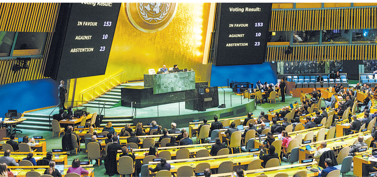
这是12月12日在位于纽约的联合国总部拍摄的紧急特别会议投票现场