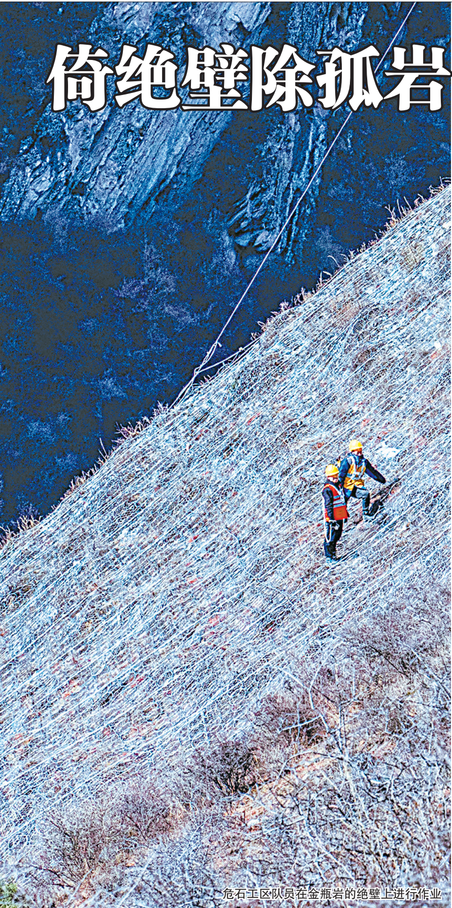
危石工区队员在金瓶岩的绝壁上进行作业