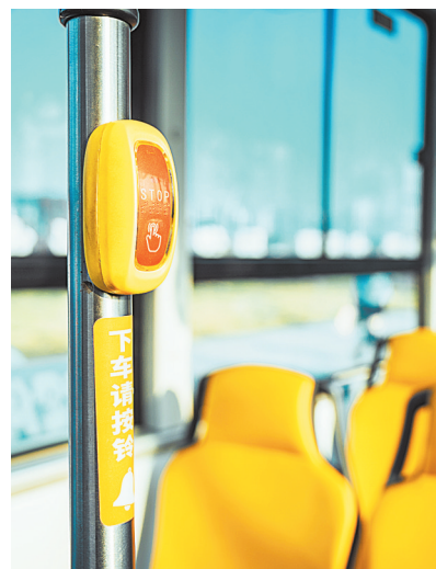
“铃停巴士”在上下客门附近立柱上设置有按铃。

记者通过查询资料发现,“铃停巴士”运营模式已在广州、珠海、香港等多个城市运行多年, 紧转03版